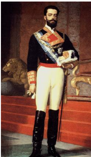
Retrato de Amadeo de Saboya