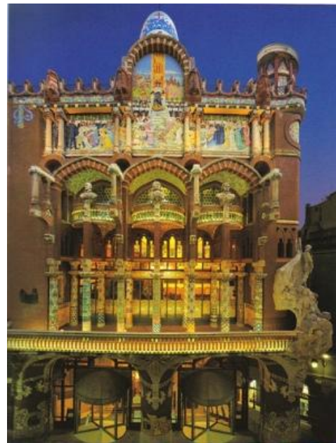
Palau de la Música de Barcelona, de Doménech i Montaner, obra del Modernismo catalán.

-¿Cuáles fueron las primeras asociaciones obreras en España? ¿De qué corte político eran?