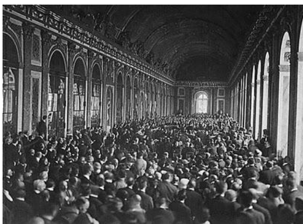
Firma del tratado de Versalles