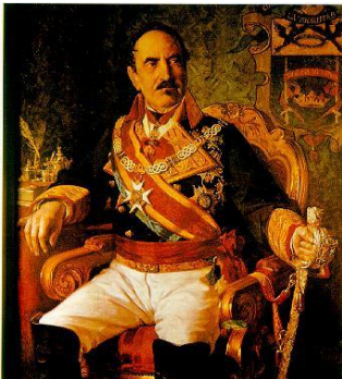
General Baldomero Espartero

-Di qué dos grandes partidos políticos se repartirán el poder en tiempos de Isabel II y qué políticos destacan en cada uno.