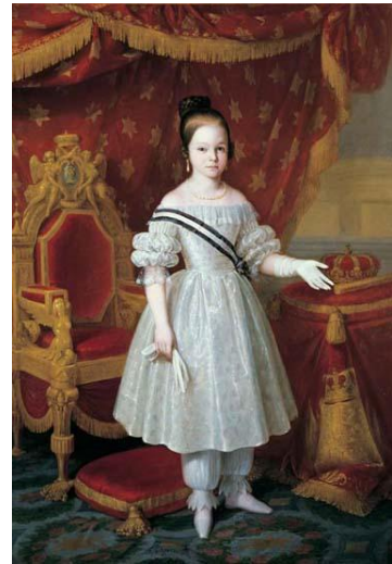
Retrato de Isabel II niña