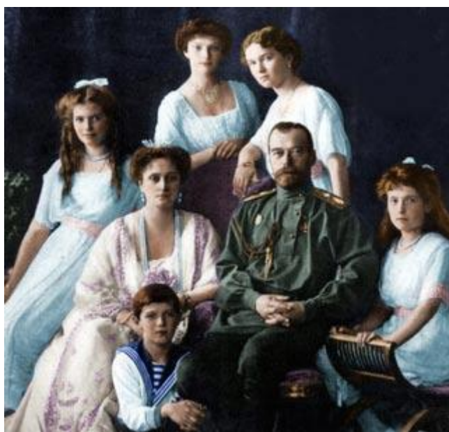
Los zares de Rusia Nicolás II Romanov y Alexandra con sus hijos, las archiduquesas Olga, María, Anastasia y Tatiana y el zarévich Alexei. Fueron ejecutados en Ekaterimburgo en 1918.