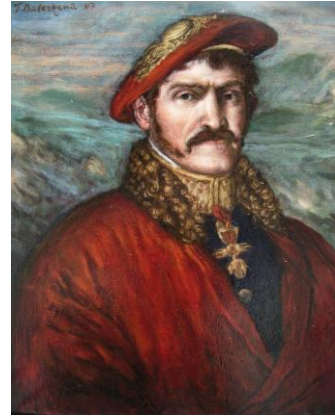
Carlos María Isidro de Borbón.

-¿Cómo terminó el Trienio Liberal durante el reinado de Fernando VII?