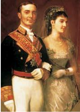
Fue apodada “ Carita de cielo ” por el pueblo de Madrid .Tenía 17 años y se casaron en la Basílica de Atocha. Desgraciadamente, la Reina murió de tífus a los pocos meses.